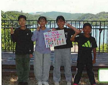
フィールドビンゴ