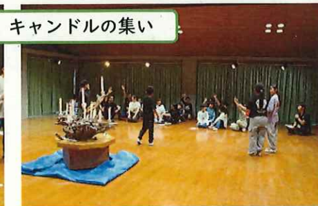
キャンドルの集い