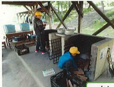
カレーライス作り